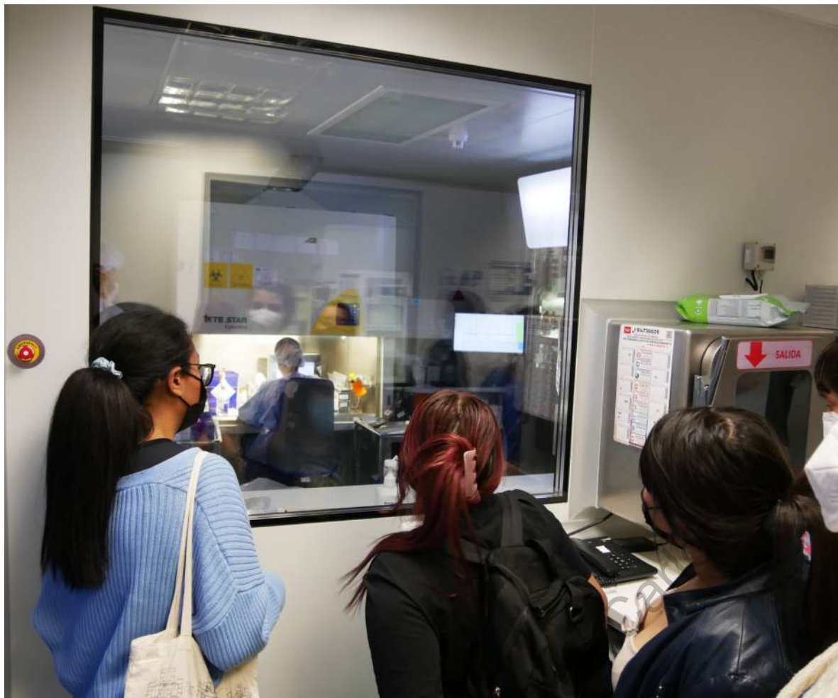
Visita Servicio de Farmacia Hospitalaria